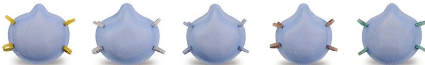
● 1510 N95 XS